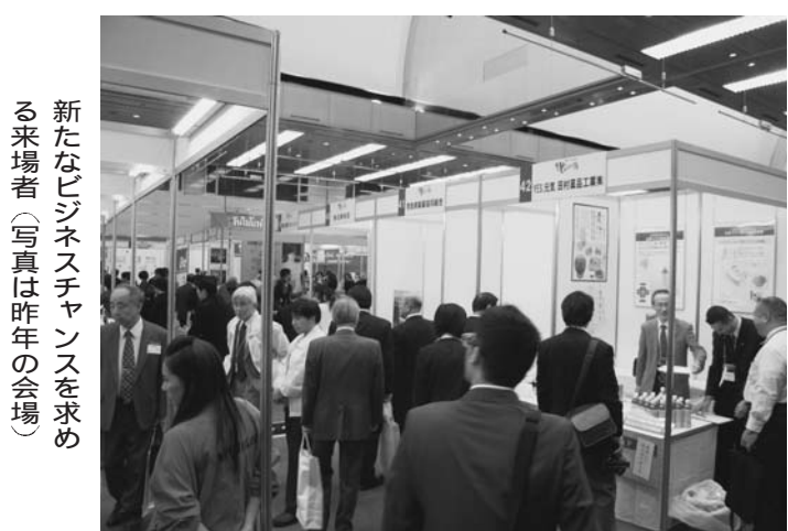
新たなビジネスチャンスを求める来場者(写真は昨年の会場)

リーマン・ショック以降、不安定な経済状況が続く。東日本大震災や台風被害などの影響もあり日本という国の活気が全体的に落ち込んでいるとの観測がある。しかし、かつて大阪といわれた商都に焦点を当てた、「伝統と匠