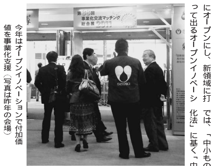
今年はオープンイノベーションで付加価値を事業化支援(写真は昨年の会場)

大阪府異業種交流促進協議会が他社との連携で自社の経営革新を図る「オープンイノベーション」事業化支援を、大阪産業振興機構が技術・モノ作りをマッチングする「オープンイノベーション」支