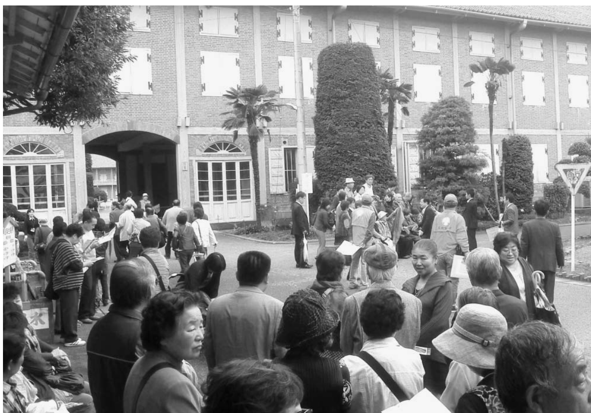
平日もツアー客でにぎわう旧官営富岡製糸場