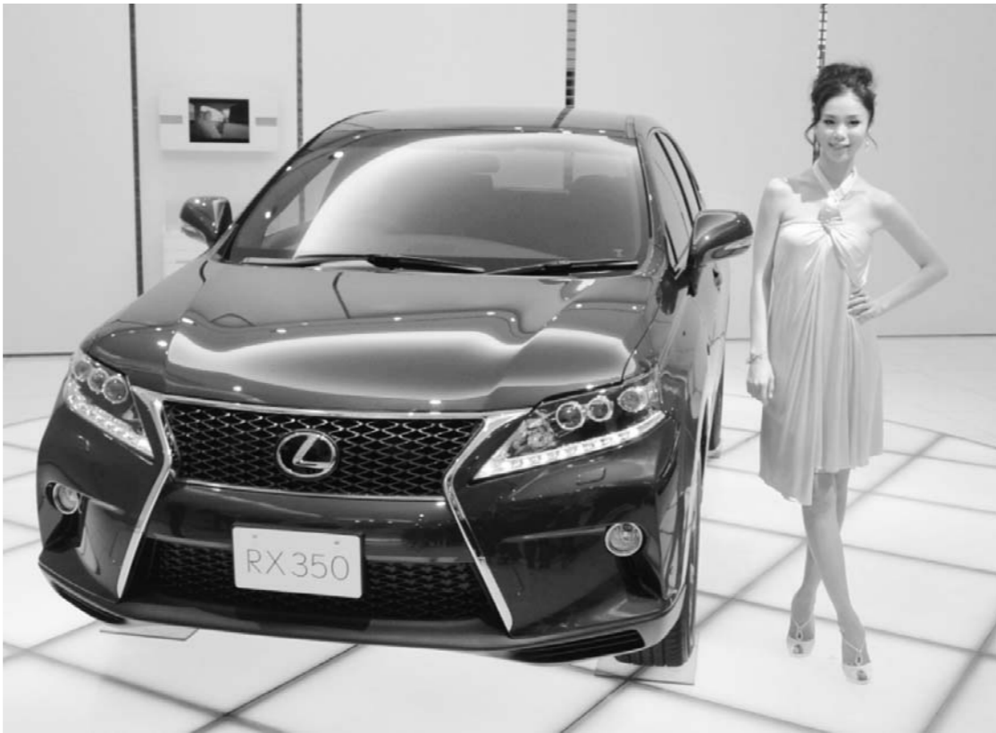
高級車ブランド「レクサス」には新デザインを採用