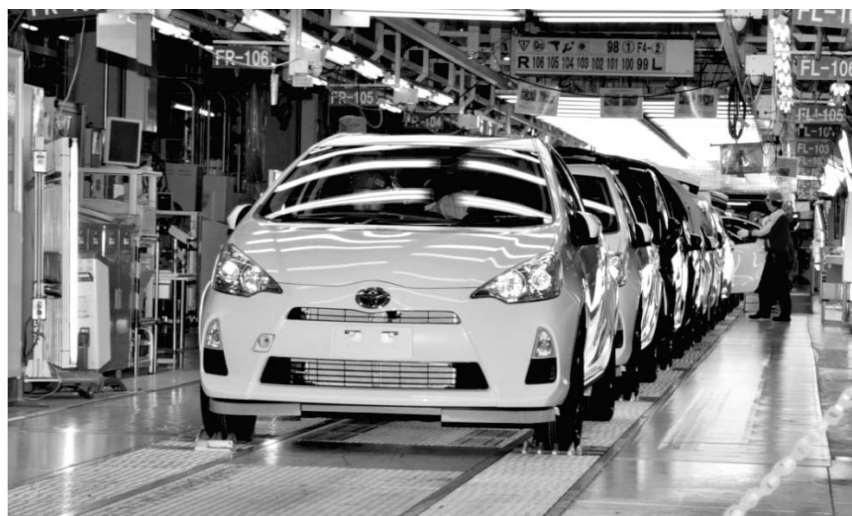
得意のHVや新興国戦略車で、販売数を伸ばす(売れ行きが好調な小型HV「アクア」)