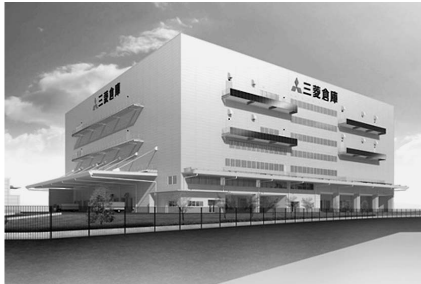
三菱倉庫が埼玉県三郷市に建設中の「三郷2号配送センター」完成予想図

ですが、倉庫も物流の結節点における保管、仕分け、在庫管理などにおいて、公共性の高い社会インフラとしての重要な役割を果たしており、また、防災に加え、環境問題への取り組みも進みつつある。照明器具や空調機を省エネルギータイプに変更するなどの取り組みのほか、倉庫の屋根や外壁を利用した太陽光発電パネルの設置事例も増えており、パネル価格が低下してきており、倉庫施設を太陽光発電パネルの設置場所として有効利用することで、これまで以上に環境負荷低減を推進できる可能性がある。