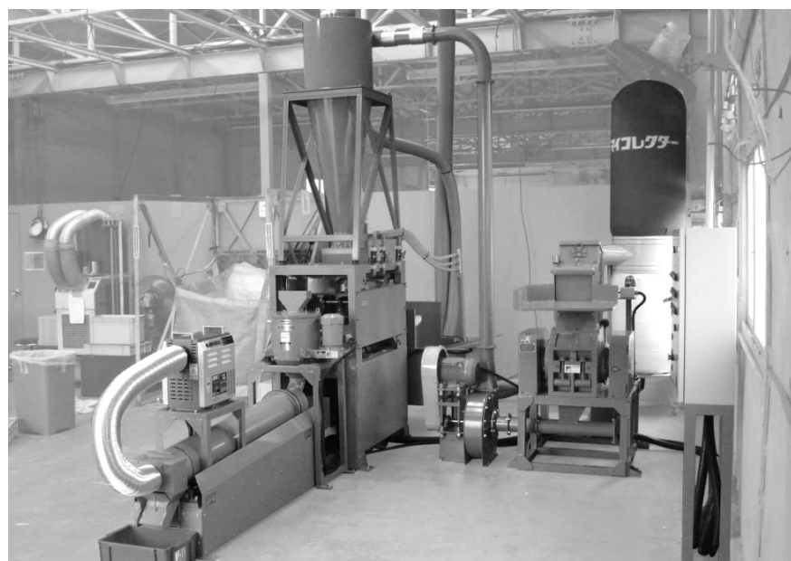
需要が拡大し、増産する三立機械工業の廃電線リサイクル機