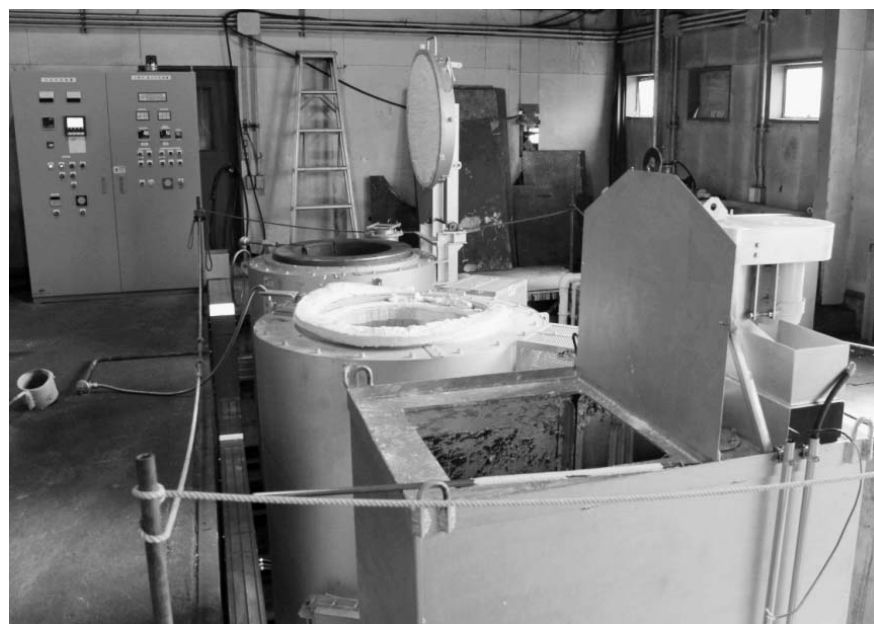
ハイテック精工は大型の熱処理炉を導入し、事業拡大に挑む