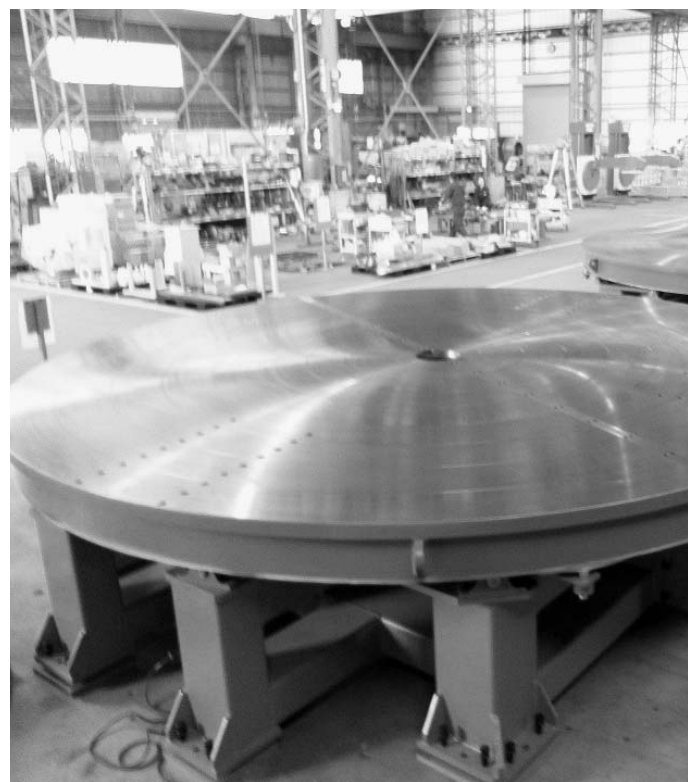
ラインワークスは中国に新工場を稼働させて大型溶接支援機の増産に入った