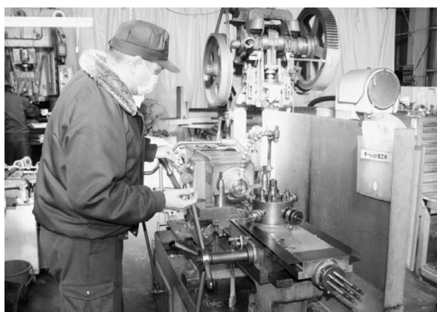
新栄工業は中古のタレット旋盤で少量超短納期の加工に挑む

千葉市には約3万の事業所が存在し、その大多数が中小企業だ。長引く不況のうねに、東日本大震災による節電対策や円高など、企業を取り巻く環境は厳しさを増している。そんな中、市内企業はあらゆる手を打ち、成長を見据えて努力を重ねている。とっている対策は、各社の業態や規模などによって一見異なるが、注意深く見ていくと、いくつかのパターンに分けることができる。市内企業の奮闘する姿を紹介する。