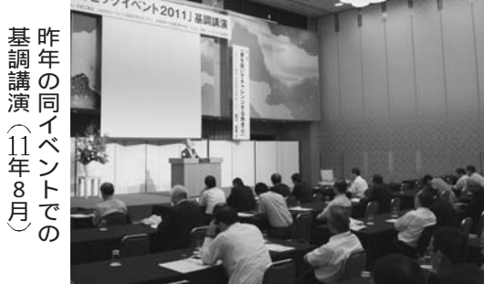
昨年の同イベントでの基調講演(11年8月)

「夏のビッグイベント」は、情報技術、先端技術、研究開発などに関するテクノフォーラムとして毎年8月に開かれ、多くの入場者でにぎわう文字通りの兵庫工業会の「ビッグイベント」。