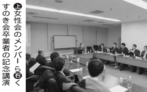
女性会のメンバーら。くすのき会卒業生の記念講演