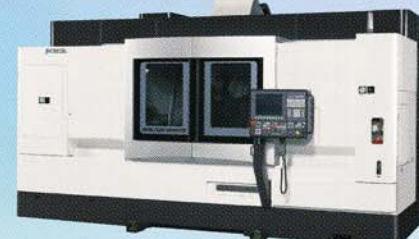
インテリジェント複合加工機