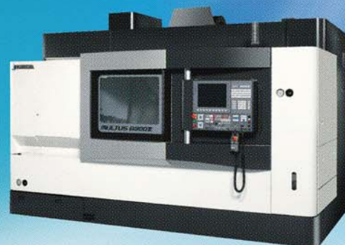
インテリジェント複合加工機