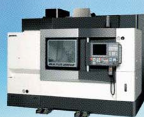
インテリジェント複合加工機