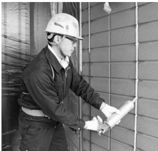
各社がリフォームに注力している（旭化成リフォームのリフォーム現場）

子会社の旭化成リフォームが手がけてきた。これまでは外壁塗装や屋上の防水シートの張り替えなど保守・メンテナンスが中心だったが、現在は住宅設備機器などの新設にも取り組む。特に太陽光発電など環境対応設備機器のニーズ