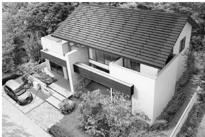
住友林業の「新スマート ソラボ」は日産「リーフ」から住宅への電力供給ができる