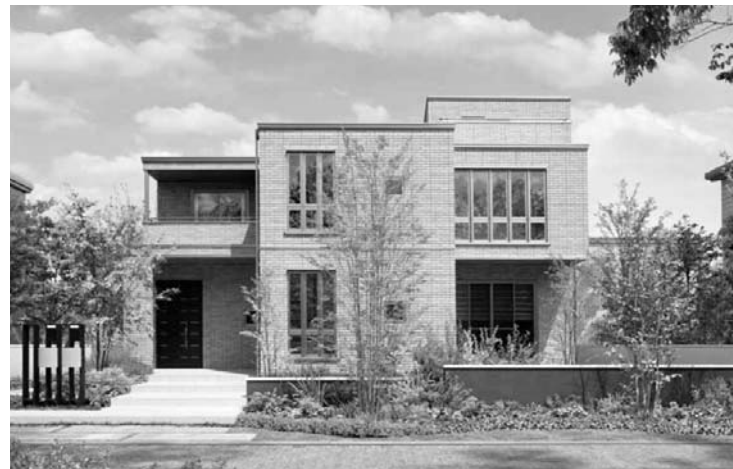
二世帯住宅を含む建て替えの多様なニーズに対応した積水化学工業の「Newパルフェ」

一方、スマートハウスなど新設住宅と並行してこれまでのストック住宅の活用に向けて官民が動きだしている。 国土交通省は「中古住宅・リフォームトータルプラン」を策定し、20年までに流通・リフォーム市場を現在の倍となる約20兆円を目指している。そのため、市場環境の整備や資金面での支援を盛り込んだ。 民間では早くから各住宅メーカーがストック住宅事業を展開してきた。都市部を中心に一戸建て住宅「ヘーベルハウス」を展開する旭化成ホームズでは、自社で供給した住宅のリフォーム事業を