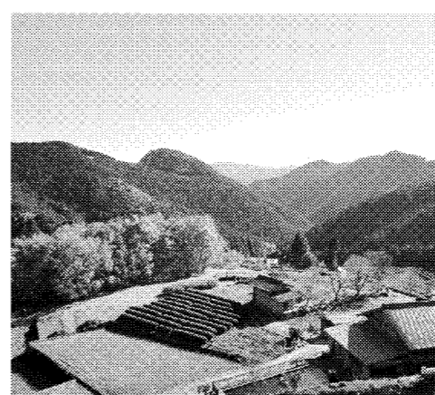
緑あふれる豊かな自然も東三河地区の宝(愛知県・東栄町)