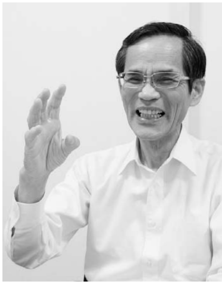
大分産業人クラブ会長「さびえる」本舗社長