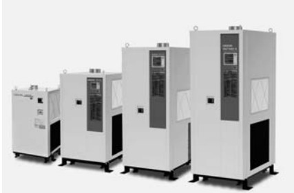
ヒートポンプバランス制御方式を採用した省エネ精密空調装置

同シリーズは加熱回路に電気ヒーターを使わずに温度を調節。従来の温度制御システムで25度Cの空気を23度Cに下げるには、冷凍機でいったん18度Cに冷やした後で電気ヒーターで加温して23度Cにしていたため、エネルギーの無駄があった。開発したヒート