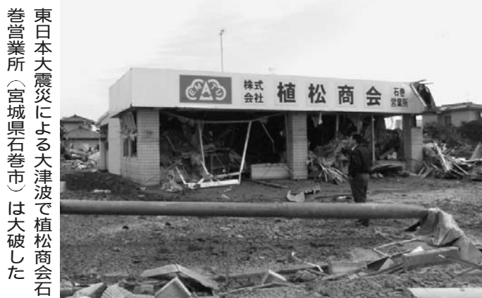
東日本大震災による大津波で植松商会（宮城県石巻市）は大破した

東日本大震災による大津波で植松商会（宮城県石巻市）は大破した。倒壊した建物の瓦礫が、周囲に散らばっている。背景には、震災後の荒廃した街並みが見える。