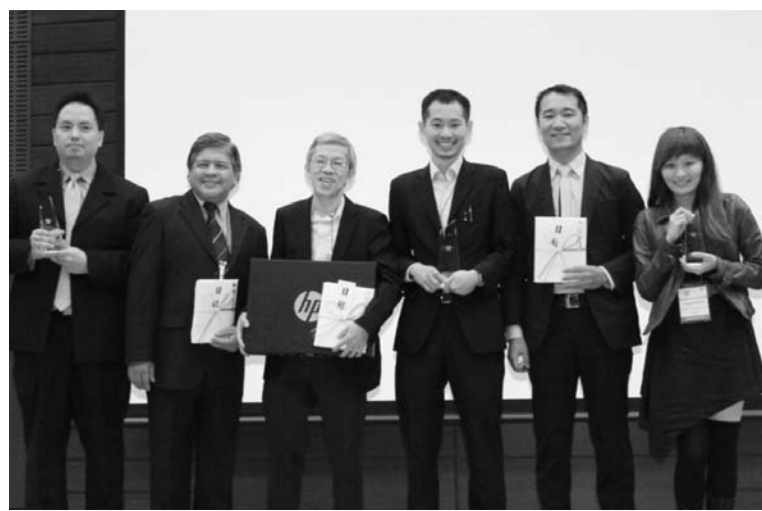
A E Aの入賞者たち