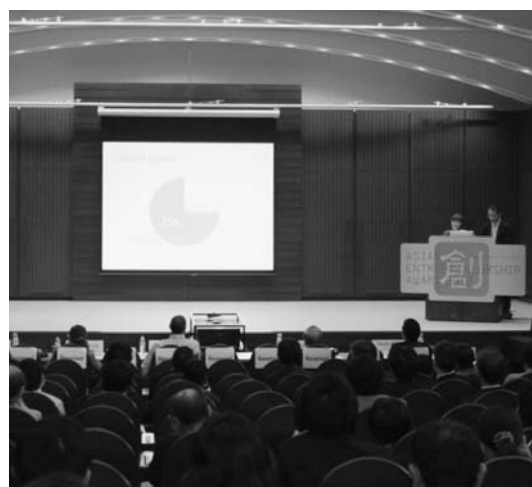
A E Aの決勝戦には 100人以上が来場した