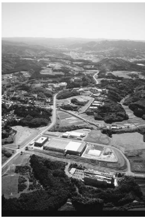
再生計画が策定されたかずさアカデミアパーク

県は3月、同団地の再生計画を策定。圏央道と12年度から立地規制緩和を進めて、企業が進出しやすい条件整備を整える。ポイントは誘致対象業種の拡大。従来はハイ