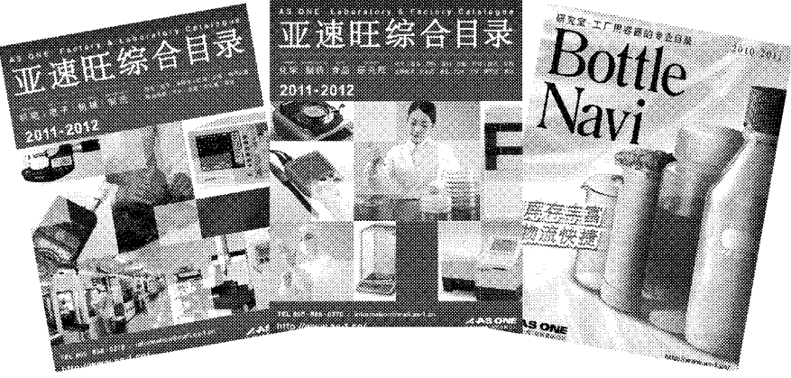
総合カタログ 電子・機械系編 総合カタログ 化学・食品研究所編 容器類専門カタログ