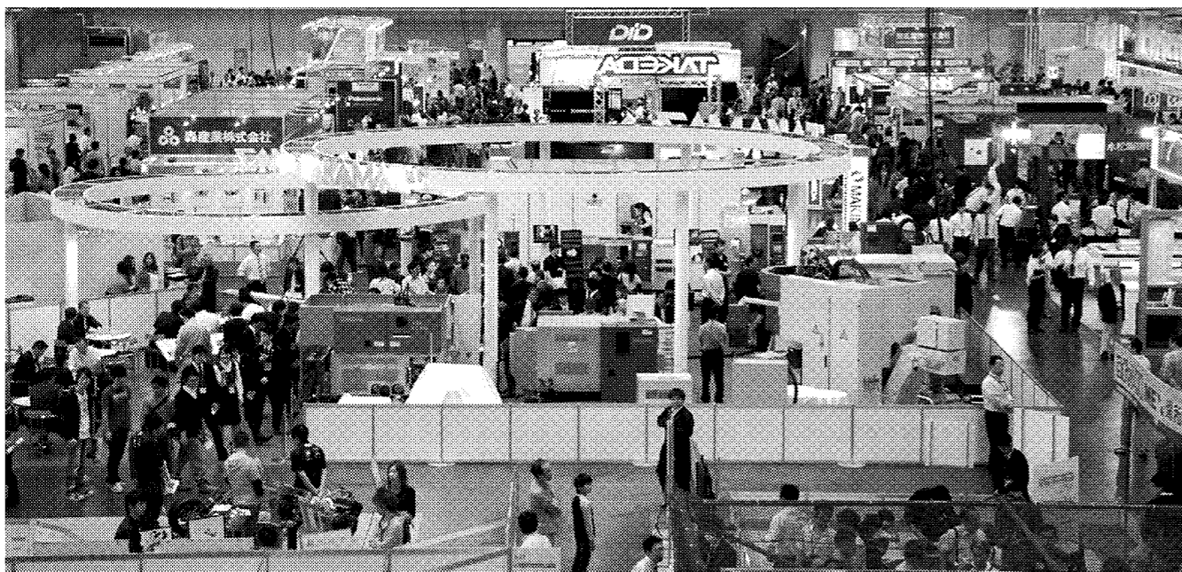
大勢の来場者が詰めかけた「MEX金沢2011」