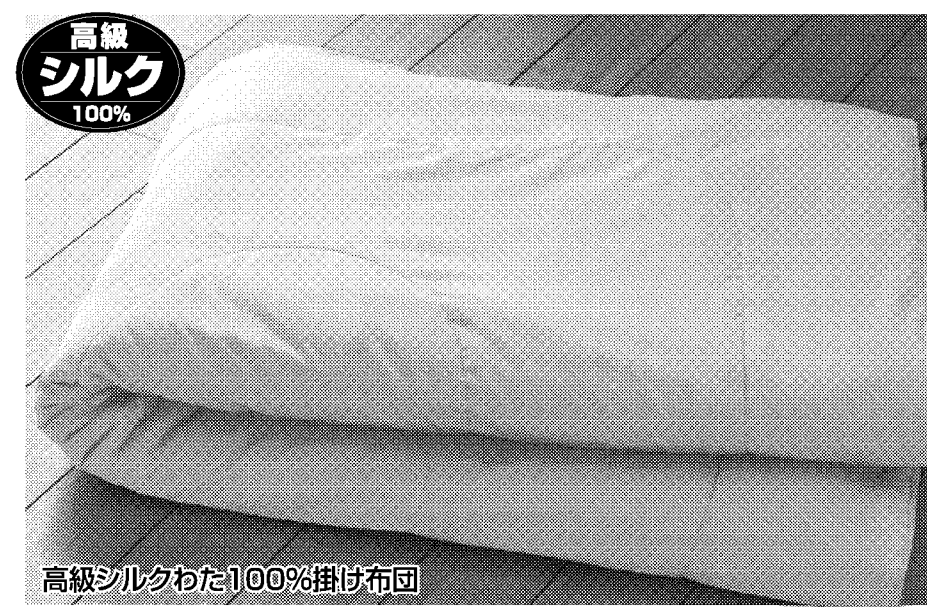
高級シルクわた100%掛け布団

高品質のシルクのみを入れた、通気性バツグンの布団は、ユーコーでしか買えない程の人気商品です。