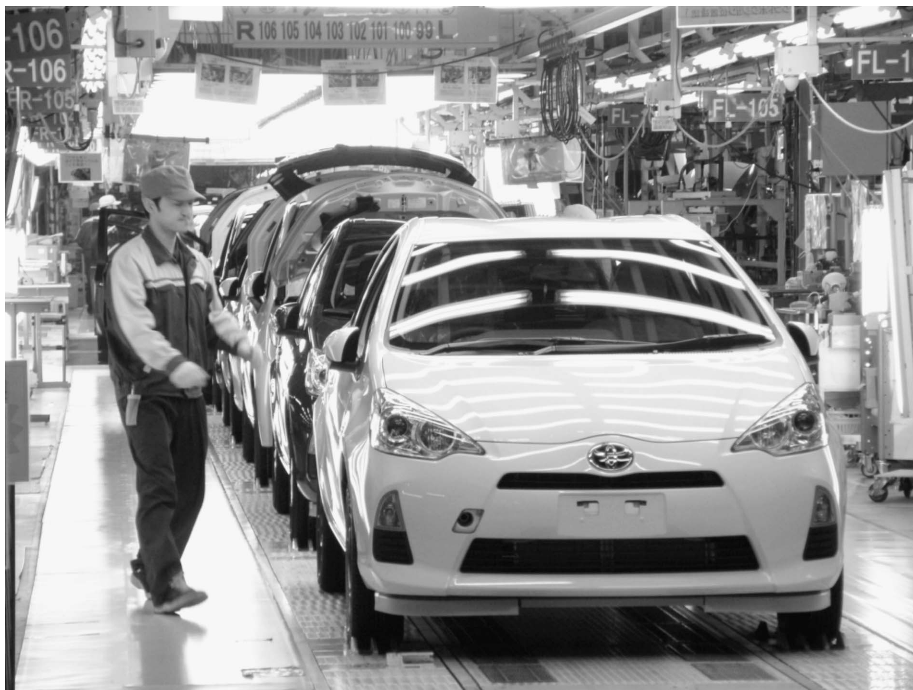
関東自動車工業岩手工場（岩手県金ケ崎町）ではトヨタの新型小型HＶ「アクア」をフル生産