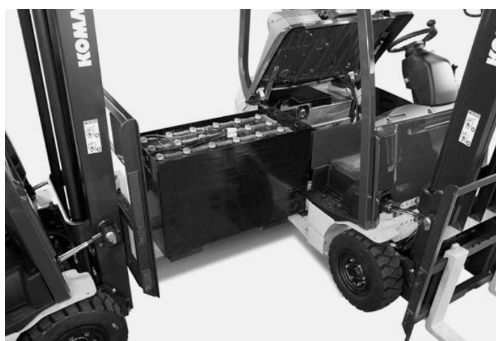
重いバッテリーをフォークリフトで簡単に交換

12年の国内販売・輸出の見通しについて、内外の景気の動きが年初よりよいので、今後見直しの必要があるかもしれないが、年初段階では国内販売は微増、輸出が微減で、合計では横ばい（JIV）とみている。12年の世界市場については、フォークリフトメーカーは市場ニーズに対応するため、さまざまな装備などを提供している。例えば、チェーンで吊り上げて行っていたバッテリー交換に対して、大きく重いバッテリーを車体右側からフォークリフトを使って簡単に交換できるような仕組みが、これまで12年の世界市場について、ある大手フォークリフトメーカーは、欧州債務危機や新興国の成長鈍化などの影響から市場の伸びが鈍化する予想している。とはいえ、日本の大手蓄電池メーカーの中で、14年までにタイで行っている電動車用鉛蓄電池の生産能力を、現在の2倍に高めることを決めた企業もある。環境意識の高まりから、さらにASEAN・豪州での需要が伸びると判断し、競争力を高めることにしたもので、フォークリフトの市場ニーズが底堅いのは間違いないようだ。