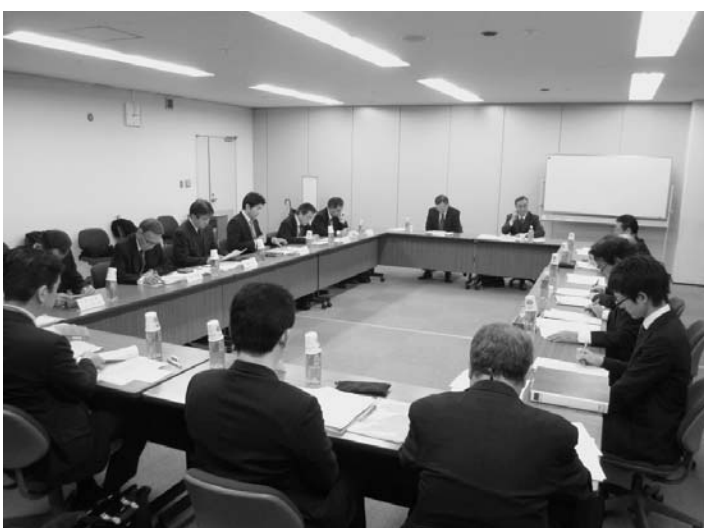
フォークリフトの重要部品に不具合があれ、安全に関連する各種規格の制定・改正が検討

安全にも配慮しており、フォークリフトの存在を車両の周囲で働く作業員に訴えるシステムを提案している。フォークリフトの後方や、見えにくい場所などにおける作業員を検知し、注意を喚起するシステムが登場している。同システム対応のタグを付けた作業員が、あらかじめ設定された距離範囲内に入ると、警報音や回転灯で運転者や作業員に注意を促し、事故を未然に防ぐ。コンパクトで軽量のタグが振動し、危険を通報する仕組みもある。