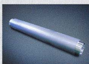
CIGS系太陽電池パネル用 スパッタリングターゲット材