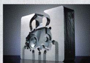
ダイカスト金型用銅 DAC-MAGIC®

日立金属では、製品の環境負荷を低減するために環境適合設計アセスメントを導入し、製品の設計・開発を行っています。すべてのライフサイクルにおいて環境への負荷が少なく、地球環境へ貢献できる機能を持つ環境親和製品の割合をこれからも拡大していきます。