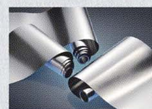
アモルファス金属材料 Metglas®