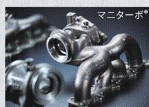
耐熱鋳造部品 ハーキュライト®シリーズ