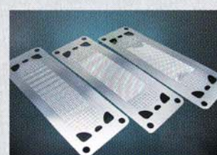
固体酸化物形燃料電池用 インターコネクター材ZMG®232シリーズ