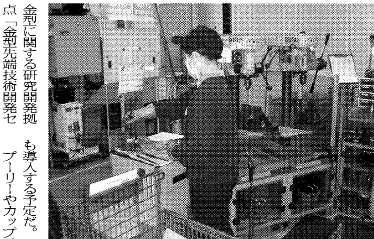
効率化で顧客対応力を強化する鍋屋バイテックの生産現場

車向けの受注増に対応するもので、現状の年間100万台から13年3月までに同300万台分の生産能力を確保する。和井田製作所はドイツの研削盤メーカー、ハースと特殊研削盤の相互販売で提携した。和井田はハース製品を日本や中