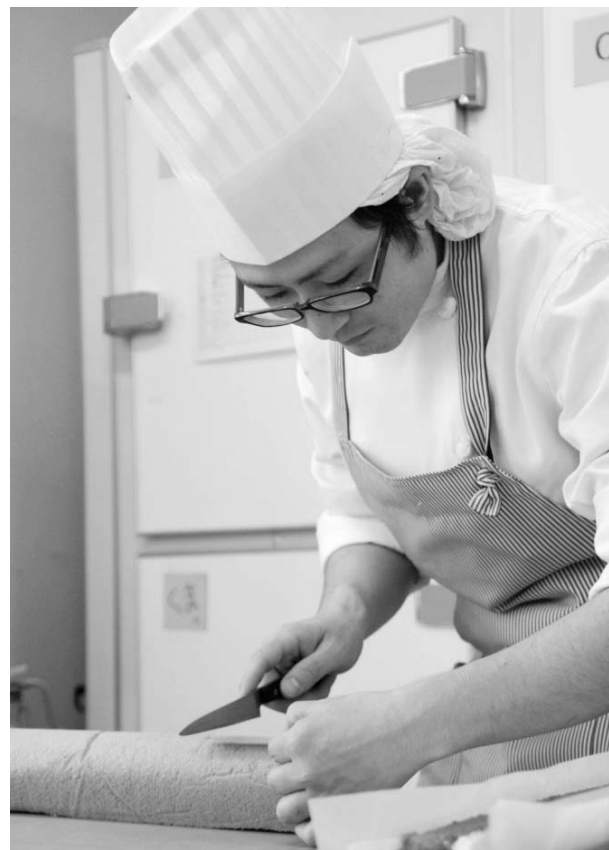
厨房に入ると表情が一変

2012年4月で入社丸3年。任される菓子も徐々に増え、後輩もできた。現在は主に生菓子を担当する。夢を尋ねると「自分の店を持ちたい。このオペラみたいな店です」と迷いはない。「でも」と続ける。「自分はまだまだ。オシェフは何でもできる。だからこそオシェフなんです。今はとにかく、いろいろなことを学んで吸収したい」と、未来の三ツ星シェフは力を込めた。