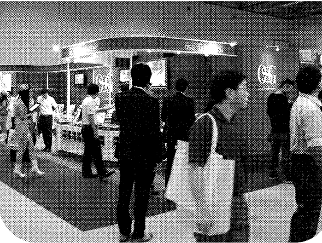
にぎわったMECT2011(OSGの展示ブースで)

▽国内の工作機械専門発掘点「OSGアカデミー」に研修・交流施設「ゲストハウス」を建設する。総工費は約6億円。8月に完成の予定。100人を収容できる研修設備のほか、約30人の宿泊スペース、食堂や調理場を備える。