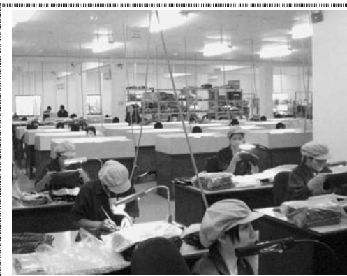
ベトナム・ハノイ市にある工場