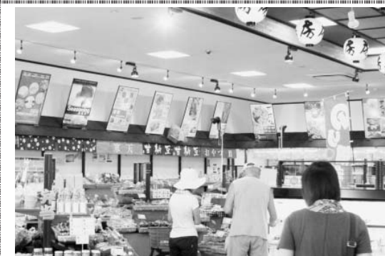
「房の駅」店内には地元千葉産の商品が所狭しと並び