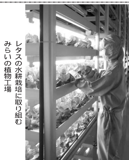
レタスの水耕栽培に取り組み、みらいの植物工場