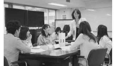
四国電力では女性社員のキャリア形成、仕事と家庭の両立支援、これを支える職場風土の醸成に向けて、取り組みを展開している。

「3年目となる今年は、これまでの取り組みを踏まえ、さらに活動を強化していく。具体的には、管理者啓発を見据え女性の活躍をリードしていく層を対象としたセミナーを開催する。また支店をはじめ各職場が自律的に取り組みを進めていくことで、女性社員の能力発揮を促し、さらなる活躍の場を広げたい。」