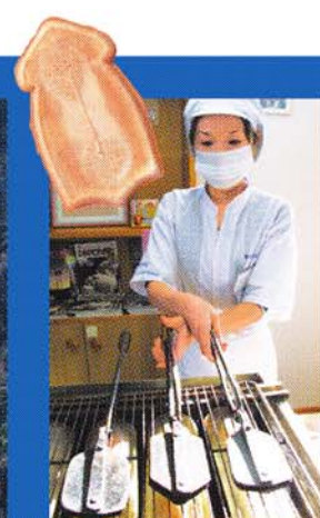
いかにせんべい焼き体験はいかが? 2人以上で要連絡