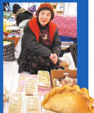
「ひゅうず」など産直ものが手に入る「宮古市魚菜市場」