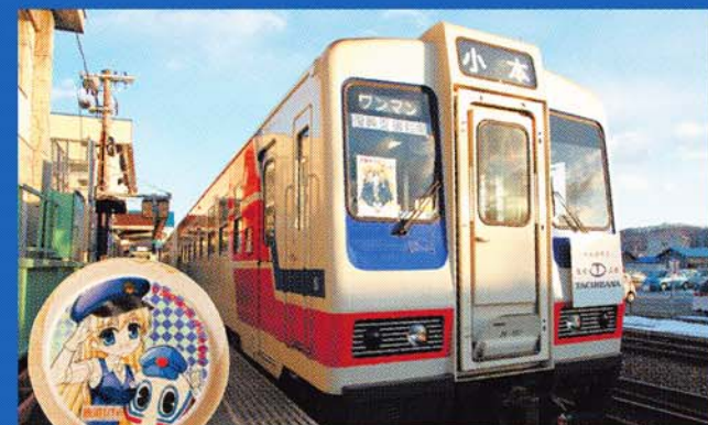
三陸鉄道の宮古駅で、キャラクター入りの南部煎餅を発見!