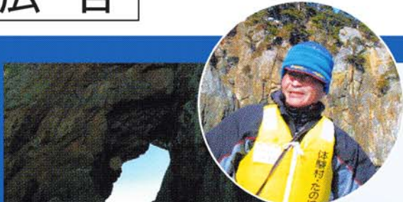
サッパ船に乗れば、北山崎を海から眺められる。現役漁師の巧みな操船技術も見もの