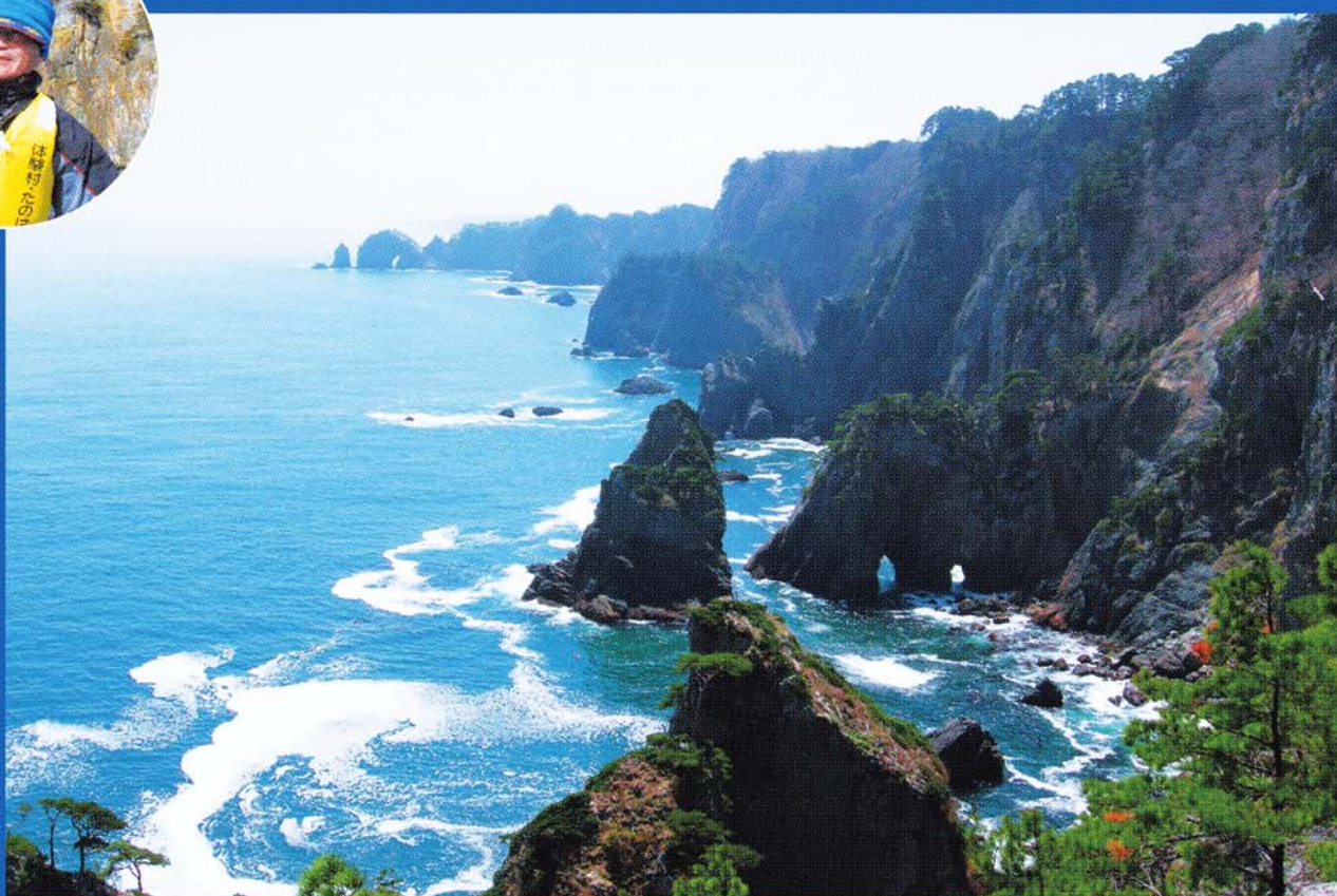
およそ8キロにわたって続くリアス式海岸ならではの壮麗な北山崎の風景。手軽に展望台から堪能できるほか、トレッキングコースもある