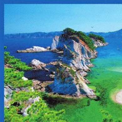
震災後も変わらず美しい浄土ヶ浜。陸からも、遊覧船からも観賞できる