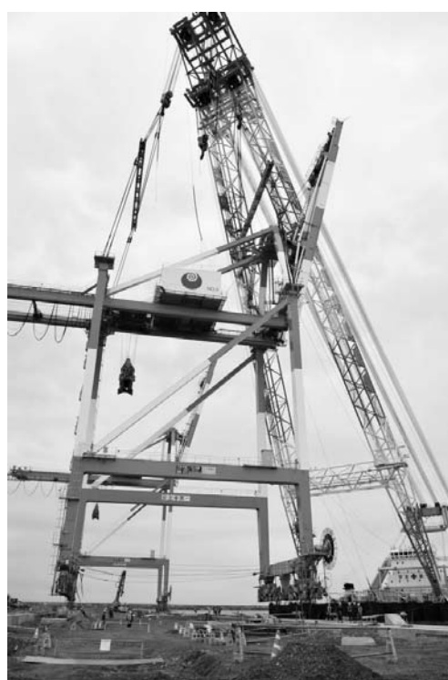
復旧作業が進む常陸那珂港のガントリークレーン