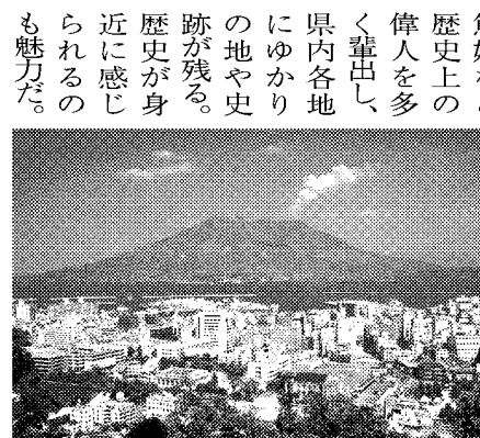
鹿児島県のシンボルである桜島

県が重視しているのが中国・上海市だ。09年3月に10年間の活動指針「上海マケット戦略ロードマップ」を策定している。同年7月には中国ビジネスの経験が豊富な「上海