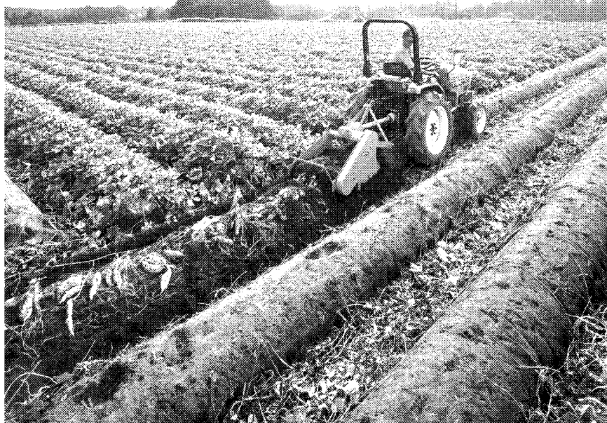
鹿児島県はサツマイモの生産量全国トップクラス

11年5月、志布志港は国の国際パルク戦略港湾に選定された。宮崎県まで広がる一大畜産地域を背後に整備された飼料タミナルは国内有数の規模を誇る。県は今後、西日本地域への穀物輸入、配分機能を強化していく