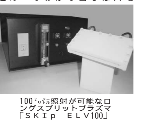
100億円の面型プラズマ発生装置「SKIP ELV100」

「2012年度の方針は、飛躍の年にしたい」と、昨年末は世界最大級の面型プラズマ発生装置が大きな話題になったのは大気圧発生装置や、石英事業など商品群の充実が進んでいる。昨年は創業10周年を迎えたが、今年からは新しい10年の1年目とし