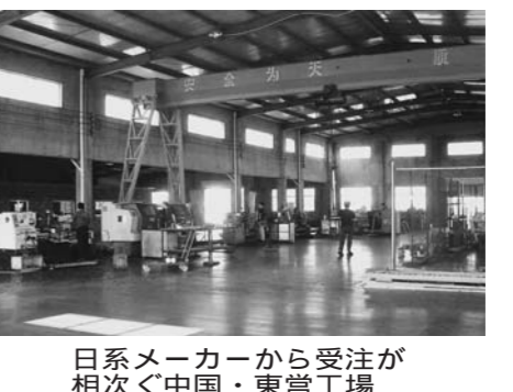
日系メーカーから受注が相次ぐ中国・東営工場

中国・山東省東営市に日本の中企業専用工業団地を整備するプロジェクトが、2011年から動きだしました。この団地は、2001年に開設した第1工場（上海市）をはじめ、第2工場（同）、第3工場（東営市）と、独自資本で三つの子会社を立ち上げてきた。中国で事業をするのに必要なノウハウを蓄積している。特に、単独では進出が困難なモノづくりの中小企業に、一緒に進出してほしい。募集職種は機械加工、板金、製缶、熱処理、鍛造、金型、射出成形、設計、エンジニアリングなど、さまざま。現地では日本企業が協業して一貫したモノづくりの共同受注グループを築き、旺盛な現地の設備ニーズを取り込む。