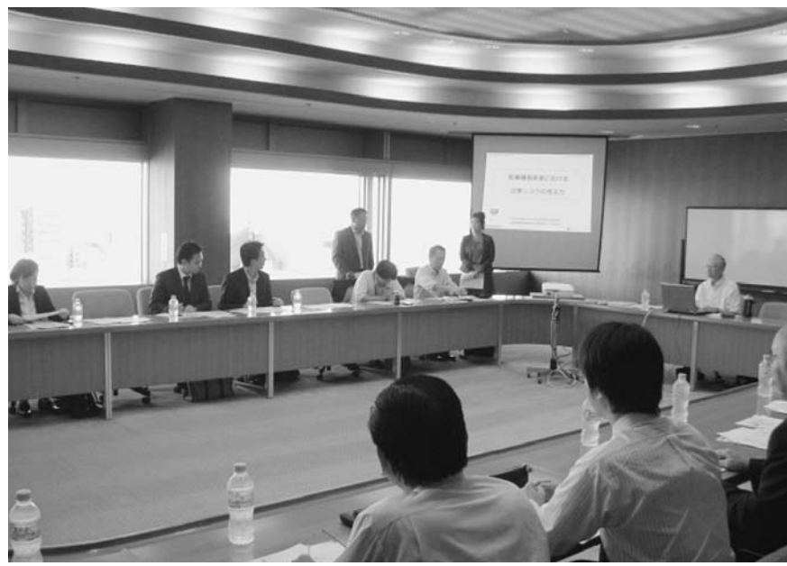
医工連携研究会のセミナー

療現場のニーズをとらえた「器械出し看護師ロボット」の開発をテーマにセミナーを開き、さらにセミナー1回、大学訪問1回の開催を予定している。 先端研究の拠点に 一方、羽田空港は2010年10月に新国際線ターミナルと4本目のD滑走路が開業した。川崎市は羽田空港の南西、多摩川の対岸に位置する「殿町3丁目」に環境技術・ライフサイエンス分野の研究拠点を形成し、高度な先端技術を有する大学・研究機関・企業などの集積・連携を促進する機能を担う。合わせて臨空関連産業の集積で、地球規模で人々の幸福に寄与する拠点を目標としている。 主要機能は動物飼育室や培養・MRI・R・I(放射線)実験室、産学連携実験室などで、脱臭・化学物質除去設備、実験排水の確実な放流設備、屋外機器用防音壁などの主要設備を備えている。投資額は建物が約35億円、設備が約10億円の合計約45億円。 世界に一つだけ 実中研は全国の医学・薬学・生物系の研究機関、大学・製薬会社、動物生産者など、産学公民連携研究センター(仮称)で、環境・ラ