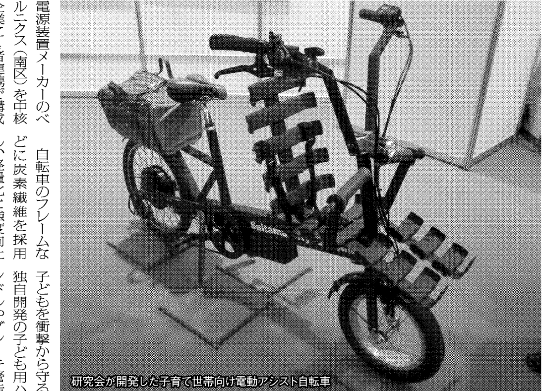
研究会が開発した子育て世帯向け電動アシスト自転車

個別支援に加えて、昨年度から、オープン・イノベーション事業を開始した。カフェやレストランなどに集まり、リラックスした雰囲気の中で、次世代産業や技術を自由に語り合う場を設けることで、技術・製品開発につながるが狙い。