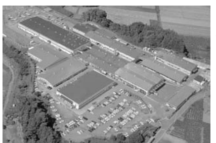
金型から成形まで一貫生産の福島工場