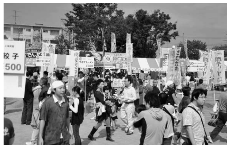
10月8・9日に神奈川県厚木市で開催された「第4回かながわフードバトルinあつぎ」

平太地区は国道16号や246号など既成の主要道、13年に全面開通を迎えるさがみ縦貫道路によってだけでなく、県央・湘南地区、横浜港へのアクセスも、リニア新幹線の新駅設置へも期待が高まっている。着々と新しい動線が張り巡らされている。