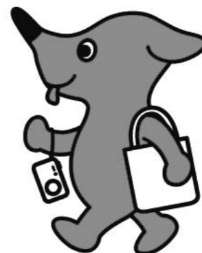
千葉のマスコットキャラクター 「チーバくん」