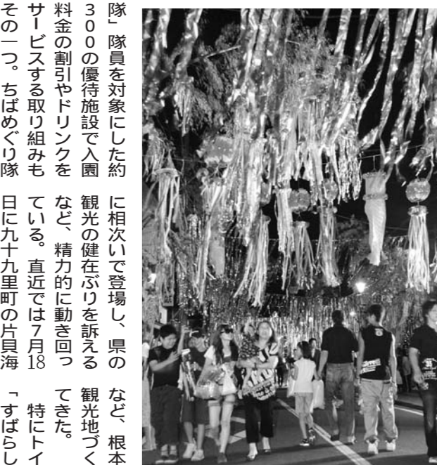
旭市七夕市民祭り。今年のは「のぼる旭 祈りを込めて」をテーマに、8月6～7日の2日間、さまざまなイベントが催される

隊員を対象にした約300の優待施設で入園料金の割引やドリンクサービスを取り組みもその一つ。ちばめぐり隊は、県内各地のイベント会場などで申し込むことで誰でも隊員になれる。隊員数は約4000人。現在も募集中だ。県が例年以上に観光振