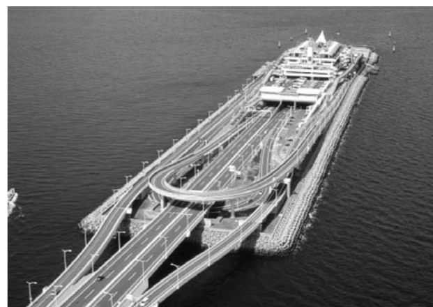
東京湾アクアライン。通行料金の大幅な引き下げで、県外からも多くの観光客が訪れるようになった

三方を海に囲まれ、大都市圏にありながら自然豊かな千葉県。夏は海水浴や花火大会、夏祭りへと、多くの観光客が訪れる。この夏も、千葉の観光地は元気だ。東日本大震災の余波が残る中でも、多くの人が地元を盛り上げ、一人でも多くの観光客を呼び込もうと奮闘している。千葉から日本を元気に。県を挙げての観光キャンペーンを中心に、県の観光支援の取り組みを紹介する。