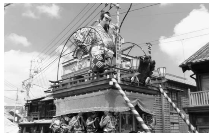
旭市七夕市民祭り。今年のは「のぼる旭 祈りを込めて」をテーマに、8月6～7日の2日間、さまざまなイベントが催される

ただで203件。8月31日までの期間中、花火大会や夏祭り、自然観察会、伝統行事など多くのイベントが開かれる。60以上の海水浴場も再開し、夏を満喫できる。森田知事は「夏の海と千葉の海」と題し、観光振興に力を入れている。今年のキャンペーン期間中は、震災からの復興をテーマにしたイベントも多い。津波に襲われた旭市は「のぼる旭 祈りを込めて」をテーマに七夕市民祭りを開き、液化の被害が大きかった浦安市は、花火大会を通じて復興に一丸となった市民の絆を一層深める。例年になく取り組みも目立つ。「ちばめぐり