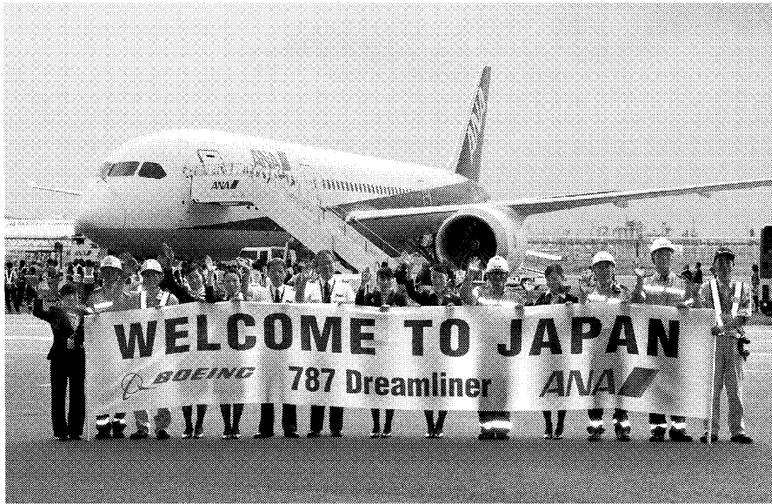
7月初旬に日本に初飛来したB787

川崎重工業は航空機やロケット製造を担う航空宇宙カンパニー。開発から生産まで手がけるボーイング787がようやく試験飛行を終え、今後の本格生産に向けて活動している。主力工場として8年の歴史を誇る岐阜工場(岐阜県各務原市)では、民間機のほか、防衛向け航空機やヘリコプターなどを手がけ、地域の航空機産業に大きな影響力を持つ。