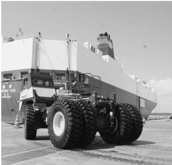
茨城港常陸那珂港で運航再開した 国内資本企業による外航船 (4月25日)