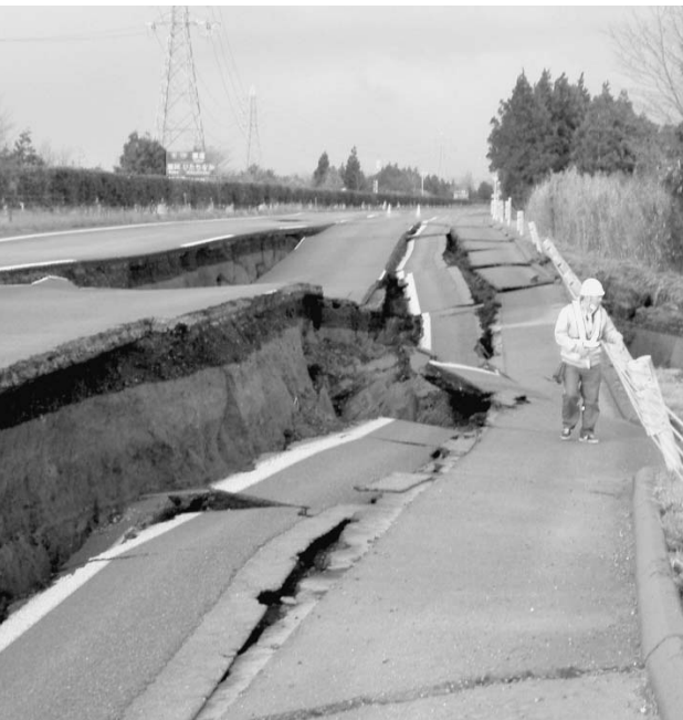
被災した常磐道上り線(水戸IC—那珂IC)④ 3月17日に復旧した④

一方、大震災により、乗り越えなければならぬ課題も見えてきた。茨城県は地震の強度や地盤の高さなど地形的には災害に強いとされている。だが、大震災など自然災害に強いとしてきた県の主張は、港湾については崩れてしまった。「今後は防災面にも配慮した港湾整備に向けて検討する必要がある」(土木部港湾課)としている。また、交通ネットワークでは、津波と液状化による被害を受けた港湾の