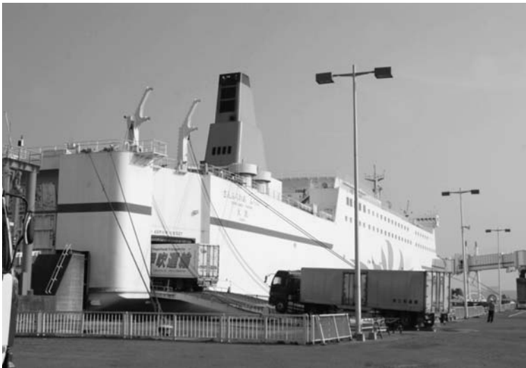
約3カ月ぶりに運航を 再開した大洗—苫小牧 間のフェリー (6月6日)