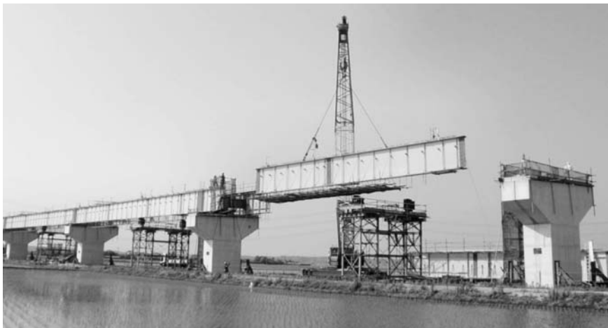
桁の架設が進む圏央道東高架構橋(稲敷郡河内町十三間戸付近)