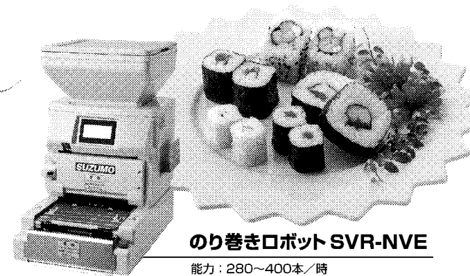
のり巻きロボット SVR-NVE