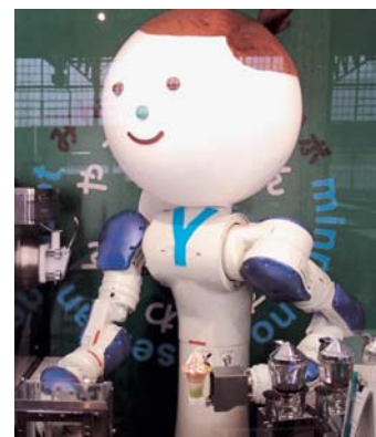
全自動ソフトクリームロボット「やすかわくん」

てくれるという。多くの来場者が詰めかける会場は熱気ムンムン。やすかわくんが作るソフトクリームを求めて長蛇の列ができること間違いなし。汗かき、甘党の人はお早めに。