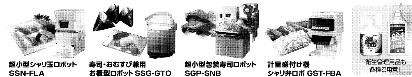
超小型シャリ玉ロボット SSN-FLA

寿司、おむすび、のり巻き、ご飯盛付、寿司シャリ作りetc... あらゆる米飯ビジネスをサポート。