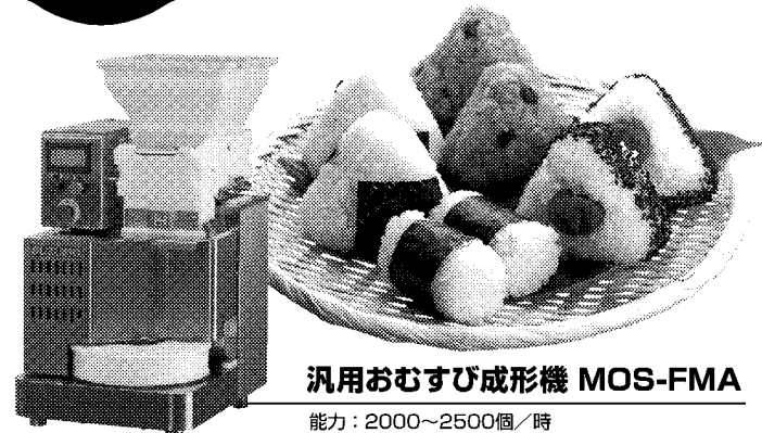
汎用おむすび成形機 MOS-FMA