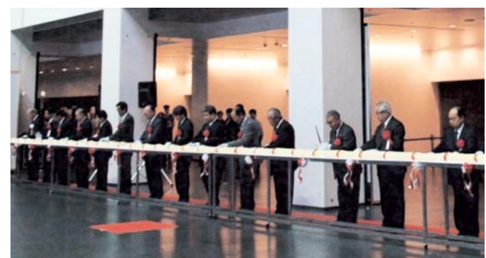
ケーキカットでお迎えする(昨年)