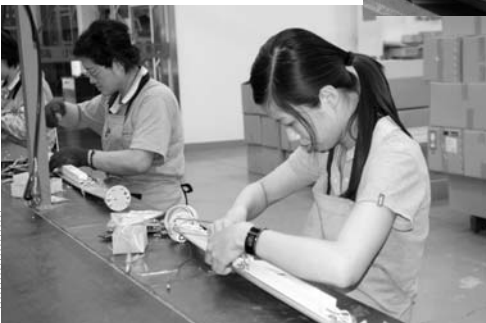
海外生産でコストを削減(台湾の照明器具製造現場)