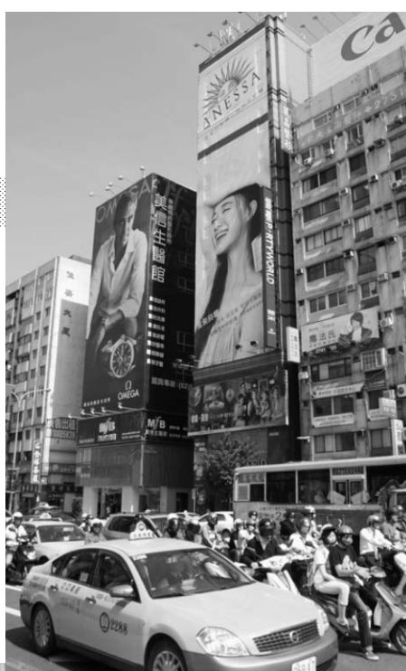
アジアのダイナミズム取り込みが鍵(台湾・台北市内)