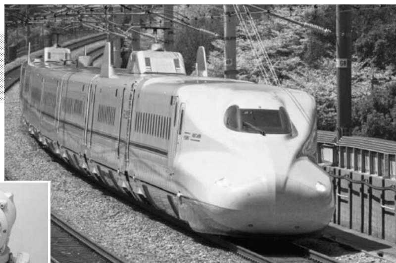
九州新幹線に内外からの波及効果を期待