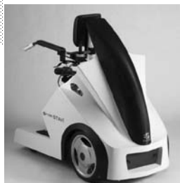
熊本県内の産学官で高機能化を進める(サンワハイテックの福祉用電動カート「スタビィ」)