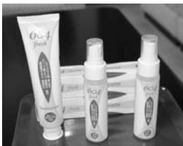
異業種からバイオ分野に進出して特産品を開発(ミソタの化粧品「604」シリーズ)