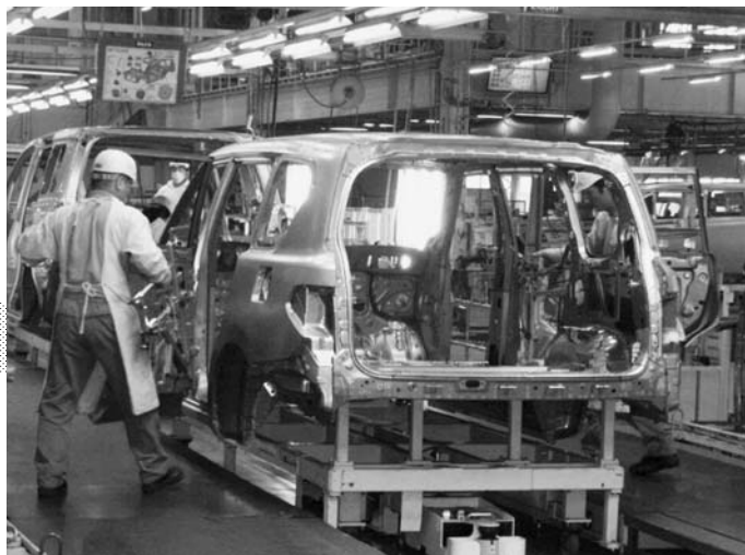
九州・山口の基幹産業は外需主導で好調(日産車体九州)