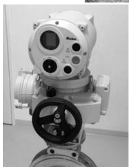
自社技術を結集して海外市場に打って出る(西部電機の新型アクチュエーター)