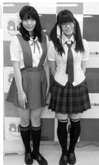
福岡県がアニメに登場する制服を発売。ポップカルチャーを通じてアジアとのつながりを強める