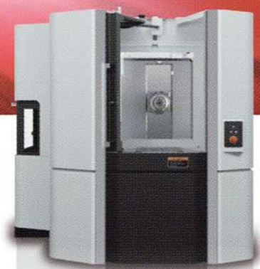
高精度高速横形マシニングセンタ NHX4000 HSC