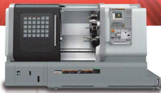
高剛性・高精度CNC旋盤 NLX2500MC/700 日刊工業新聞十大新製品賞/モノづくり賞受賞