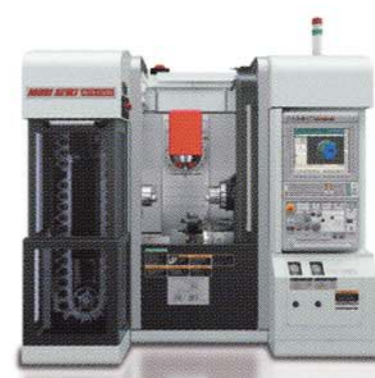
高精度・高効率複合加工機 NTX1000/SZM HSC

JAPAN INTERNATIONAL DIE & MOLD MANUFACTURING TECHNOLOGY EXHIBITION INTERMOLD 2011 第22回金型加工技術展