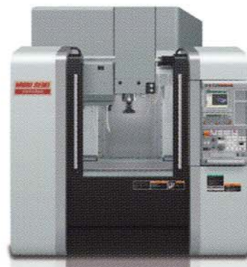
高精度高速立形マシニングセンタ NVX5080/40 HSC