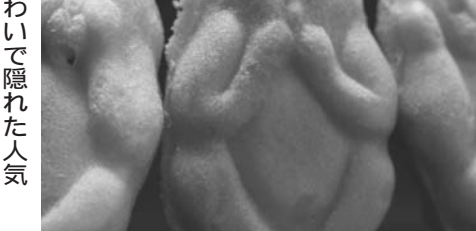
素朴な味わいで隠れた人気