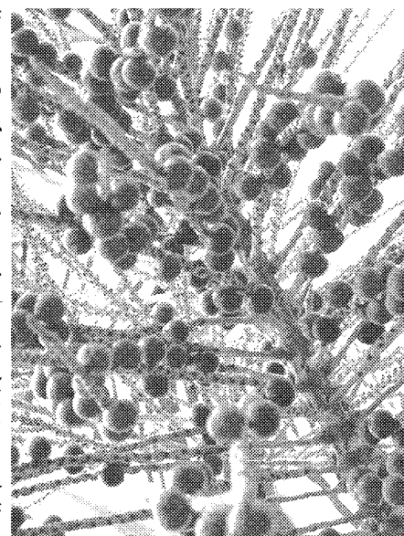
南米で自生する「アサイベリー」。豊富なアントシアニン含有量は、あのブルーベリーを凌ぐといわれるほどだ。

パソコンをよく使っているせいか、最近よく目がぼやける。ふと気づくと目頭をギュッと押さえてたり、首や肩を回したりしている。インターネットや携帯電話が便利になるのは歓迎だが、そのぶん体への負担が心配になる年頃。かといって老眼鏡やコンタクトにはあまり頼りたくないという思いも……。できれば体の中から変えたい！そう思っていたところ、友人からあるクチコミを聞いた。南米ブラジルの熱帯雨林で自生するアサイベリーという、ヤシ科の植物があるという。その果実が、最近になってアントシアニンを豊富に含んでいることが判明し、評判が高まっているというのだ。アントシアニンといえは目に重要な成分……というくらいは知っていたが、連想