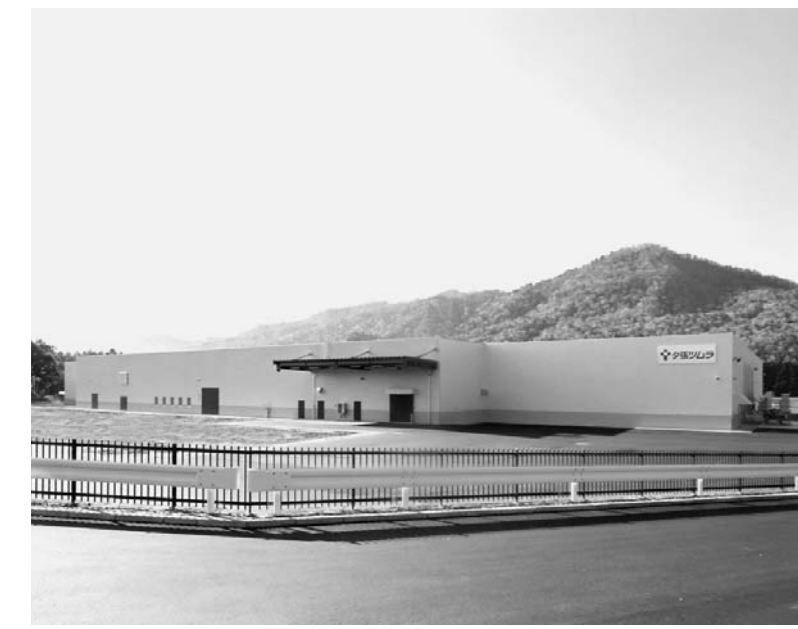
漢方薬の70%に使用される薬用植物「甘草」を巡り、国内メーカーが栽培技術の確立に取り組んでいる。

APSMEは共通問題、地域特有の問題などを取り上げ、会員が知恵を働かせ、意見を出し合い、協力して解決していく活動方針を掲げている。そして、健全な一般用医薬品(大衆薬)の産業の発展につなげている。 現在ではそれぞれが抱える問題を抽出し、プロジェクトの報告を行い、プロジェクトの継続、または新たなプロジェクトを立ち上げる予定だ。成長を続けるアジアの一般用医薬品市場。ここには日本にとって大きなビジネスチャンスがある。APSMEの活動は日本の製薬会社にとって、アジア市場との掛け橋になる。 日本医学会は国民に健康について考えてもらうため、医療情報を発信している。4年に一度開かれる日本医学会総会に合わせ、博覧会・学術展示会を開催。今回は2月24日から10日まで、東京ビッグサイトで開催。健康EXPO2011を併催。開場時間は2日17時~17時、3日からは10時~17時。入場無料。来場者は約35万人を見込む。会場は「わかもと」の3テーマで構成・展開。参加・体験型を取り入れ、幅広い年齢層が楽しめる。医療を学ぶよう工夫している。 またプレ開催として、東京・上野の国立科学博物館では医師や医療従事者のスキルアップの歴史をたどる「歴史でみる・日本の医師のつくり方」、東京・丸の内丸ビルで「サテライト展示」、博覧会に足を運べない人向けに「ネット展示」も行う。詳細はホームページ( http://ex2011.nsc.go.jp )へ。