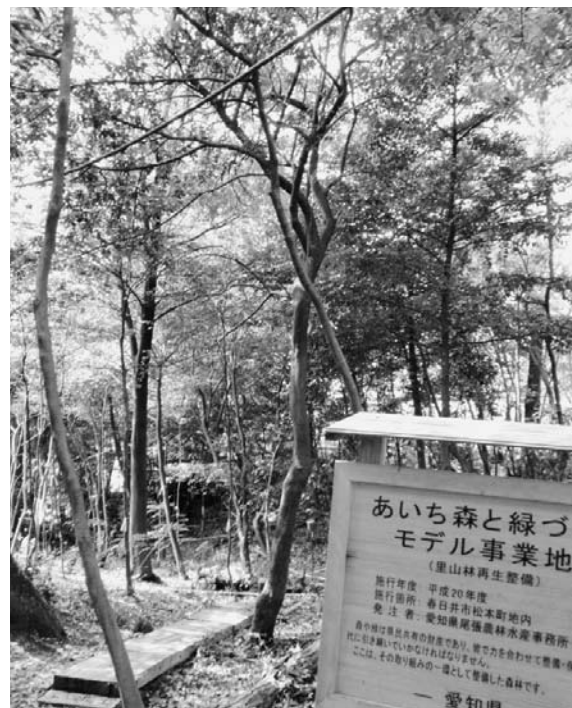
清水建設は中部大学と里山保全の研究を通して、都市の生物多様性保全の提案に生かす(中部大の実験区画)

大林組は自然環境の再生という視点で、生物多様性配慮の技術を開発する。環境省の委託により、高知県の電海中公園地区で、サンゴ礁再生のため浚渫工事を実施した。01年に高知県を襲った「西南豪雨災害」で土砂が電海中公園に多量流入。サンゴが甚大な被害を受けた。浚渫工事は同