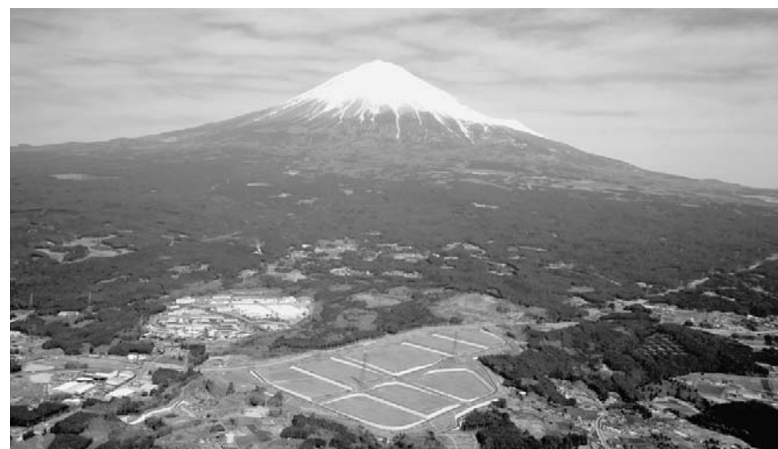
大成建設の富士山南陵工業団地

ミツバチ飼育 鹿島は他社に先がけていち早く生物多様性配慮に取り組んできた。同社が重視するのは、指標やその植物の実を食料にする鳥が増え、さらに周辺の害虫をエサにして生態系が安定する。こうしたミツバチの行動特性を利用し、地域の生物多様性回復に結びつける。