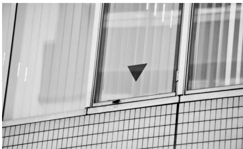
赤い逆三角形マークは消防隊の進入口

ちなみに、ビルなどの設計で高級感を演出するために、床材にビカビカとした光沢ある石を指定することがある。実はこれが大変危険で、雨の日などに表面がぬれると恐ろしく滑る。あるホテルでは足を滑らせた客が転倒して半身不随になったケースも出ている。その対策には、光沢を落とした石材を使ったり、滑り止めの薬剤を塗布したりする。もし、高級ホテルなどで比較的ビカビカしていない床を見かけたら、滑り止めのためのたとえ考えよう。