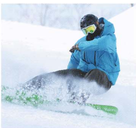
雪質の良さも人気