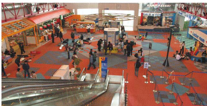
スキーセンター「カワバンガ」