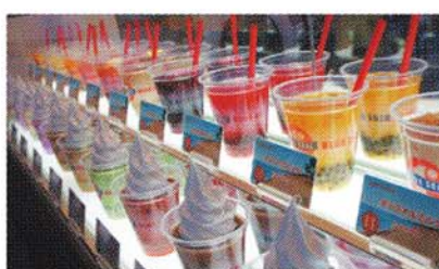
今シーズン登場の「ブルーシールアイスクリーム」