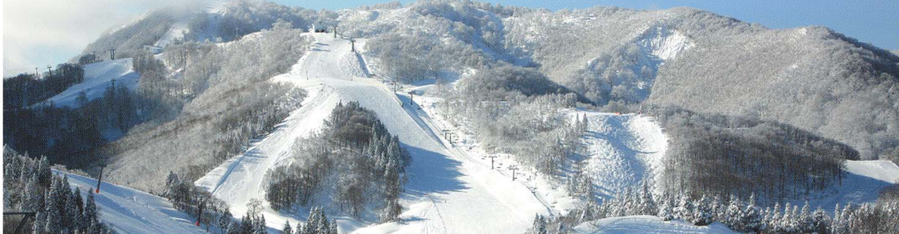
南エリア、中央エリア、北エリアと多彩なコース

今シーズン、GALA 湯沢は大きく変わりました。 全長約2.5キロのロングコースの誕生、湯沢高原・GALA 湯沢・石打丸山の3スキー場の連絡、 トップメーカー10社の最新モデルのレンタルなど、新幹線の駅と直結した気軽な楽しめるスキー場がさらに充実。 グルメや温泉も満喫できるスノーリゾートの休日をこの冬、過ごしてみませんか。